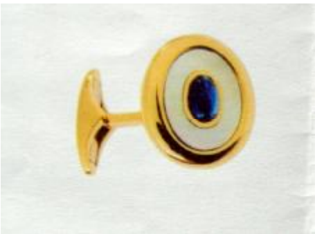
Manschettenknöpfe (Goldgehalt 750), weiß Perlmutter, in der Mitte je 1 Saphir Cabouchon (je 1 Karat)