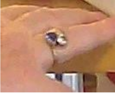
Deutlichere Abbildung: Goldring (Goldgehalt 750) mit einem Saphir und einem Brillanten (je 1 Karat); hochwertige Qualität der Steine